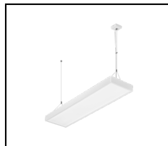
CONTRA Système de suspension LED 1200x300 (374692)