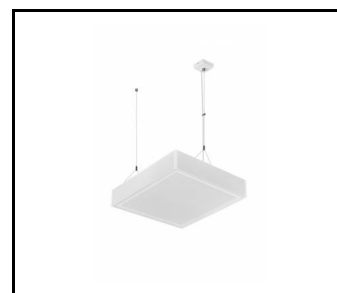
CONTRA LED-Pendelsystem 600x600 (374685)