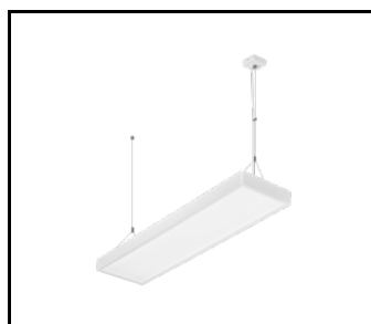
CONTRA LED-Pendelsystem 1200x300 (374692)