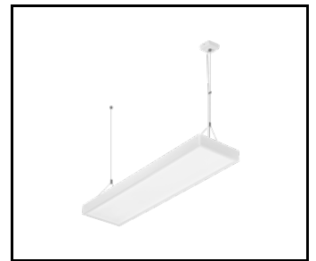
CONTRA LED-Pendelsystem 1200x300 (374692)