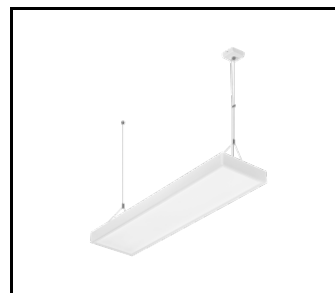
CONTRA LED-Pendelsystem 1200x300 (374692)