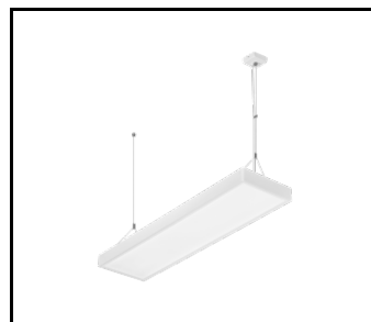
CONTRA LED system zwieszania 1200x300 (374692)