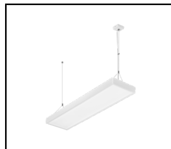
CONTRA LED system zwieszania 1200x300 (374692)