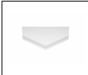
PLANO LED EVO DETAL 2