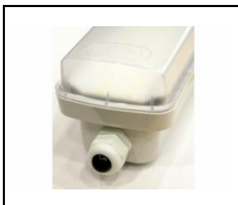
Zaslepovací zátka M16 různá PA černá - BPM-21 (60000006)