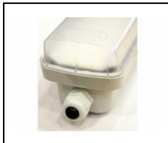
Zaslepovací zátka M16 různá PA černá - BPM-21 (60000006)