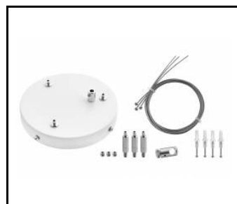
Zawieszak Coria zestaw 3 fi 150 czarny dali (556753)