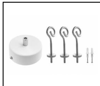
Zawieszka Coria zestaw 1 fi 100 czarny dali (556678)