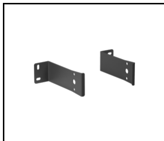
FACTOR LED HB jednoduchý přisazený držák 1M (987984)