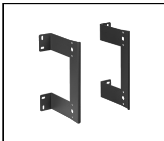
FACTOR LED HB double 2M support en saillie (987991)

Date de création de la carte: 17 janvier 2025