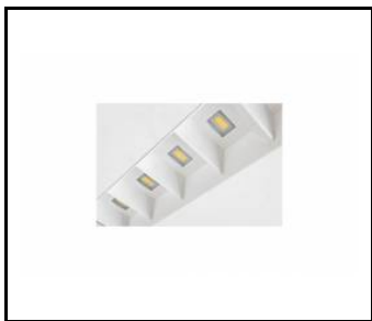
TERRA 2 LED

PODROBNÁ PRODUKTOVÁ KARTA TECHNICKÉ ÚDAJE