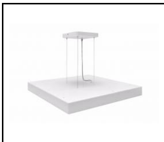
COMPACT LED EVO Z - SYSTEM ZWIESZANIA