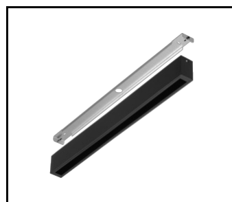
Terrano povrchový rám černý mat RAL9005 573x38x60 (420948)