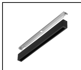
Terrano povrchový rám černý mat RAL9005 573x38x60 (420948)