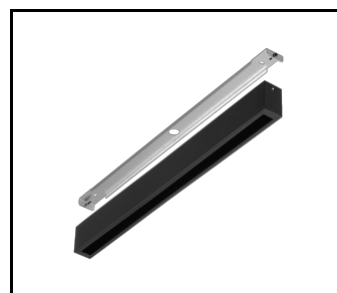
Terrano povrchový rám černý mat RAL9005 573x38x60 (420948)