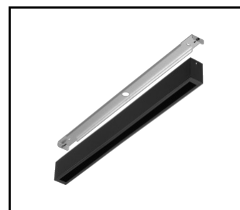
Terrano povrchový rám černý mat RAL9005 573x38x60 (420948)