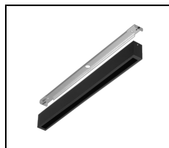
Terrano povrchový rám černý mat RAL9005 573x38x60 (420948)