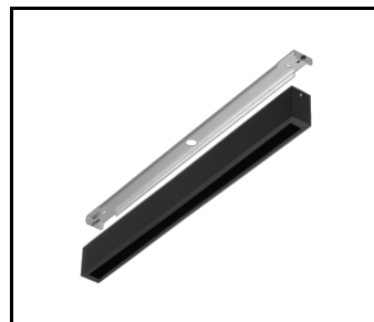
Terrano povrchový rám černý mat RAL9005 573x38x60 (420948)