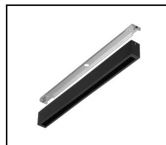
Terrano povrchový rám černý mat RAL9005 573x38x60 (420948)