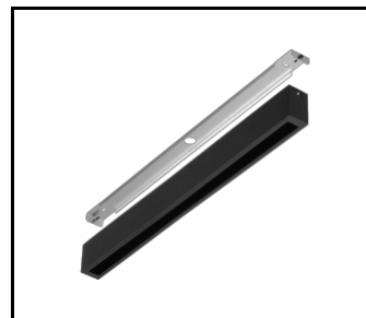
Terrano povrchový rám černý mat RAL9005 573x38x60 (420948)