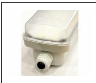
Zaslepovací zátka M16 různá PA černá - BPM-21 (60000006)