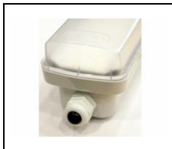
Zaslepovací zátka M16 různá PA černá - BPM-21 (60000006)