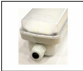
Zaslepovací zátka M16 různá PA černá - BPM-21 (60000006)