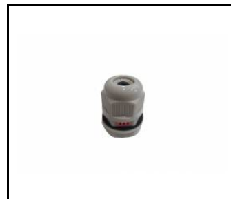
Variabilní odvzdušňovací vývodka šedá M20*1,5 IP68 (16000507)