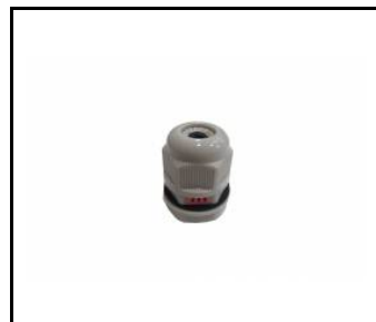
Variabilní odvědušňovací vývodka šedá M20*1,5 IP68 (16000507)