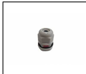
Variabilní odvětrávací vývodka šedá M20*1,5 IP68 (16000507)