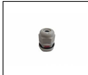
Variabilní odvětrávací vývodka šedá M20*1,5 IP68 (16000507)