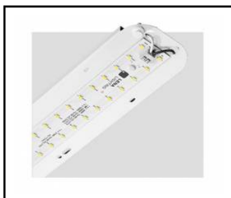
TYTAN 2 LED HALL 1450mm 10300lm 840 70D - světelný modul (367236)