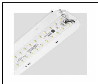
TYTAN 2 LED HALL 1150mm 8250lm 840 70D - světelný modul (367113)