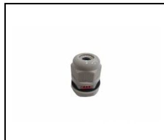
Variabilní odvětrávací vývodka šedá M20*1,5 IP68 (16000507)