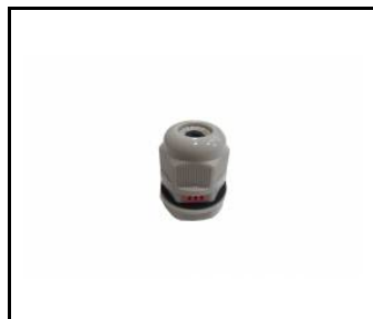
Variabilní odvězdušňovací vývodka šedá M20*1,5 IP68 (16000507)