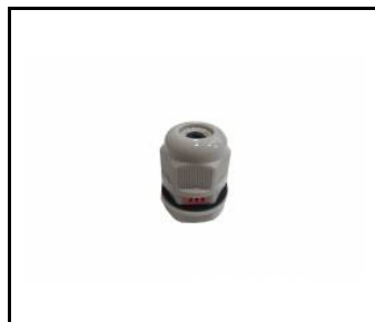
Variabilní odvětrávací vývodka šedá M20*1,5 IP68 (16000507)