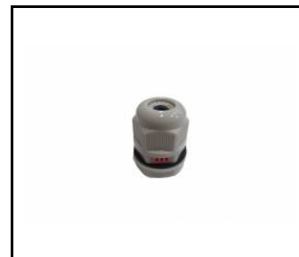
Variabilní odvětrávací vývodka šedá M20*1,5 IP68 (16000507)