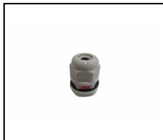
Variabilní odvěšovací vývodka šedá M20*1,5 IP68 (16000507)