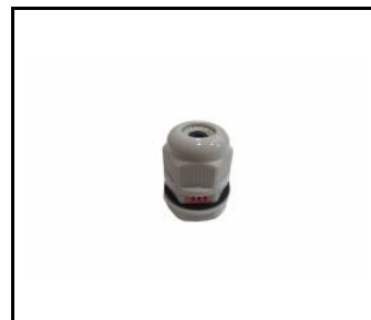
Variabilní odvězdušňovací vývodka šedá M20*1,5 IP68 (16000507)