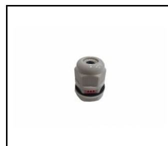
Variabilní odvodušňovací vývodka šedá M20*1,5 IP68 (16000507)