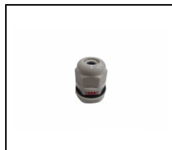
Variabilní odvodušňovací vývodka šedá M20*1,5 IP68 (16000507)