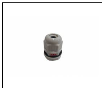
Variabilní odvodušňovací vývodka šedá M20*1,5 IP68 (16000507)