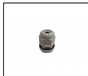
Variabilní odvodušňovací vývodka šedá M20*1,5 IP68 (16000507)