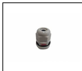
Variabilní odvodušňovací vývodka šedá M20*1,5 IP68 (16000507)