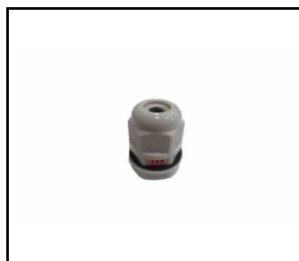
Variabilní odvodušňovací vývodka šedá M20*1,5 IP68 (16000507)