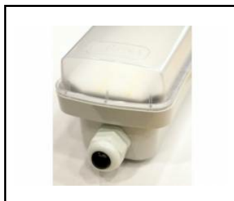
Zaslepovací zátka M16 různá PA černá - BPM-21 (60000006)