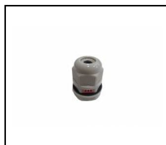
Variabilní odvodušňovací vývodka šedá M20*1,5 IP68 (16000507)