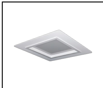
Rám čtvercový 220 pro strukturu SQ160 bílá RAL9016 (998942)