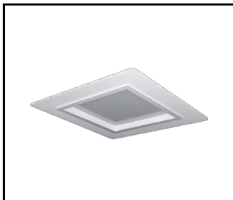
Rám čtvercový 220 pro strukturu SQ160 bílá RAL9016 (998942)