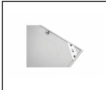
PLANO LED EVO 1