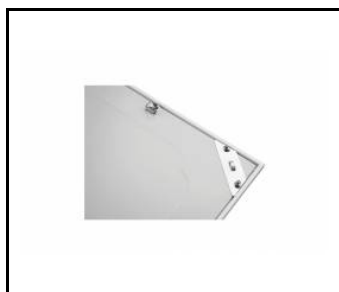
PLANO LED EVO 1