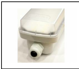
Zaslepovací zátka M16 různá PA černá - BPM-21 (60000006)