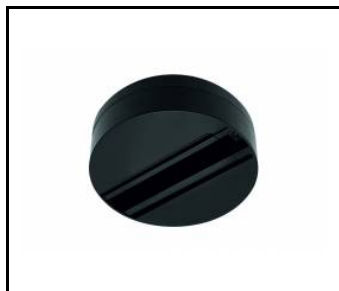
Základní jednotka EXPO SYSTEM LED pro povrchovou montáž černá (255106)