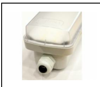
Zaslepovací zátka M16 různá PA černá - BPM-21 (60000006)