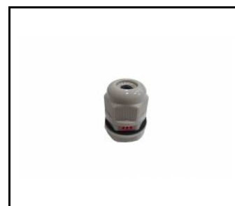
Variabilní odvodušňovací vývodka šedá M20*1,5 IP68 (16000507)