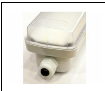
Zaslepovací zátka M16 různá PA černá - BPM-21 (60000006)