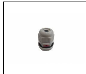
Variabilní odvodušňovací vývodka šedá M20*1,5 IP68 (16000507)