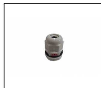
Variabilní odvodušňovací vývodka šedá M20*1,5 IP68 (16000507)