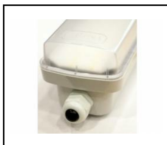
Zaslepovací zátka M16 různá PA černá - BPM-21 (60000006)